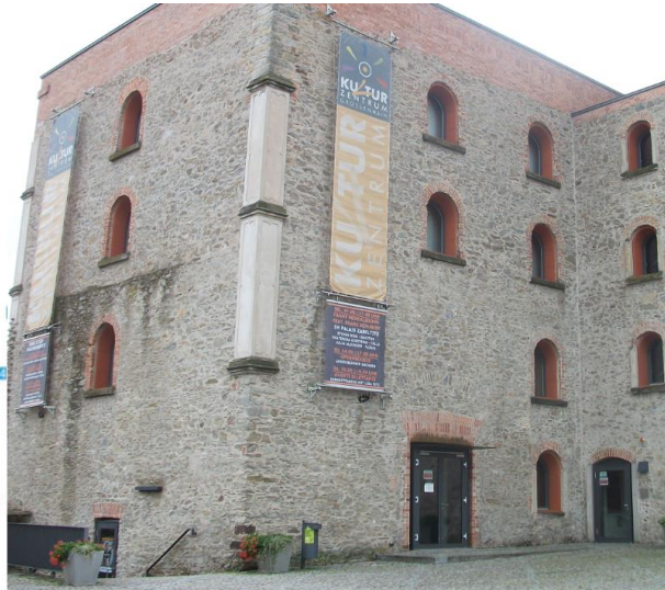
Kulturschloss Großenhain, Schloßplatz 1, 01558 Großenhain, Telefon: 03522 505555